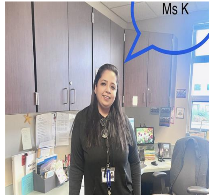
Зв'язок із залученням сім'ї