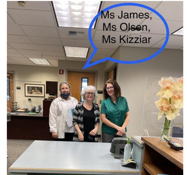
Відвідування Адміністративний асст., Реєстратор